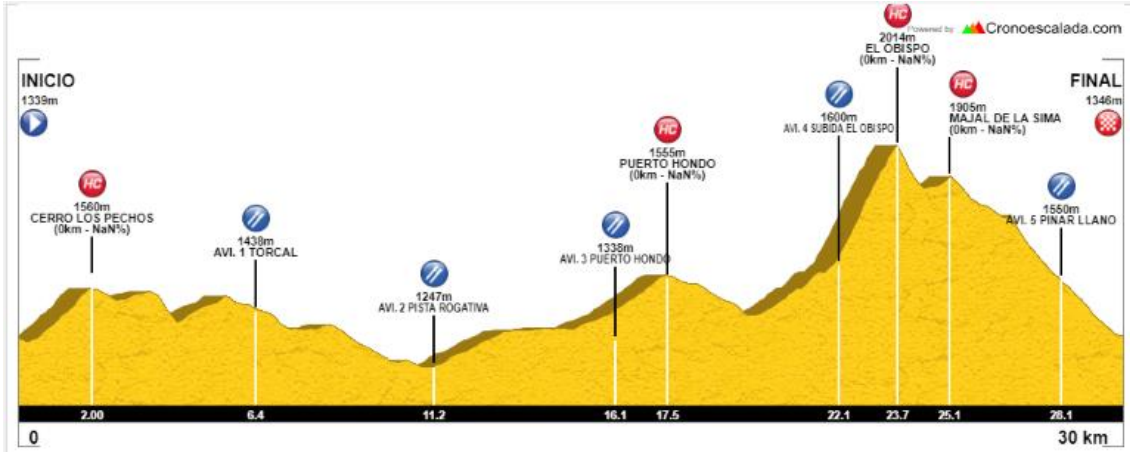
Máximo Revolcadores 30 km