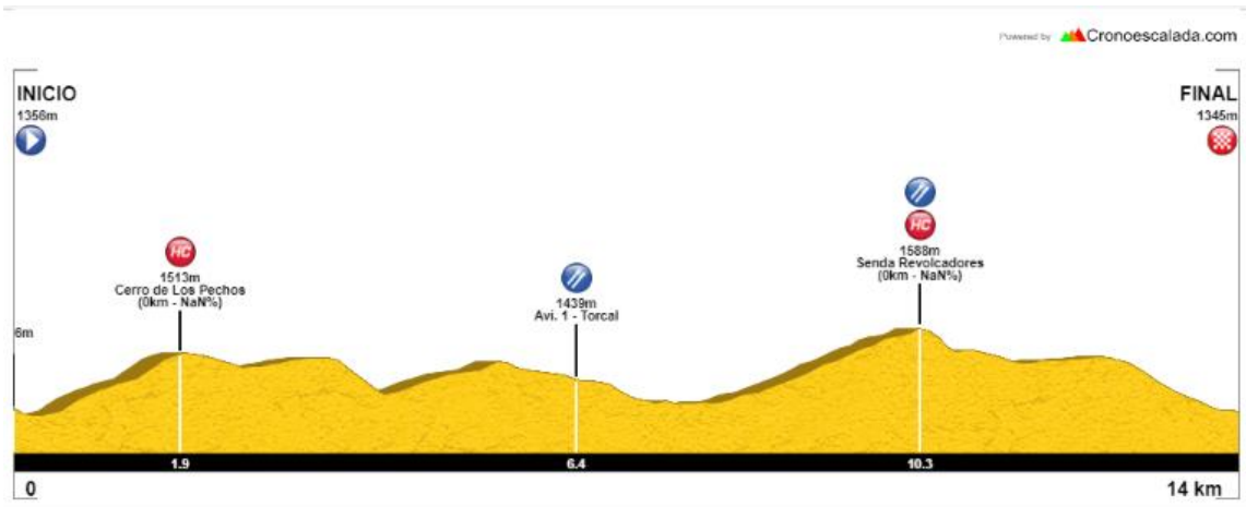
Half Rural Revolcadores y Trail Walking Hiking (Caminata) 14 km